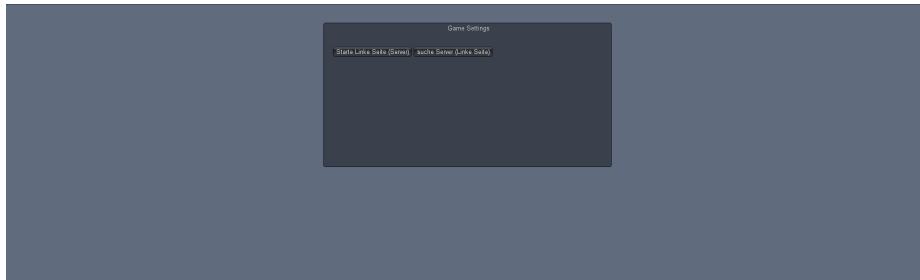
Abbildung 2: Starting-Scene

Utopya ist die komplette Szene mit der 3D-Umgebung.