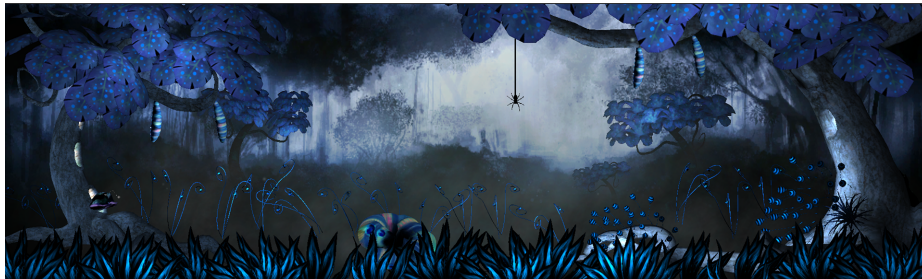
Abbildung 1: Ein Blick auf die Dschungelszene Utopya

Das Projekt stellt eine dreidimensionale Dschungel-Szene dar. Der Betrachter blickt direkt auf einen Vordergrund voller Sträucher und Bäume. Dabei kann man verschiedene Gegenstände und Objekte durch Berührung bewegen oder eine Aktion von ihnen auslösen.