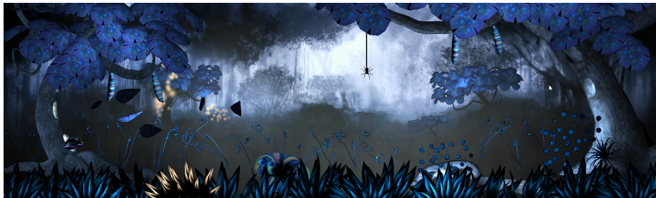
Abbildung 5: Utopya-Szene mit fallenden Blättern

Public Variablen in Skripten kann man in der Unity-Oberfläche Werte oder sogar andere Objekte (Referenzen) leicht zuweisen, die man dann in seinem Skript verwenden kann.